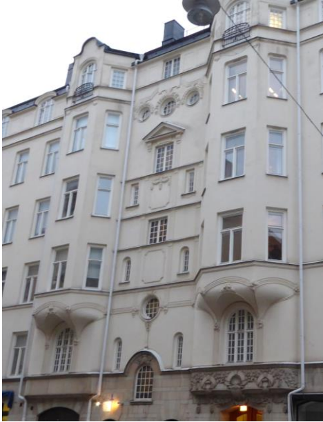
Hörnhuset Frejgatan 32/Norr tullsgatan 39

Burspråken är ofta rundade men även kantiga finns. Fönstren har större rutor nertill och ofta små ovanför. Huset till höger har säkert bytt fönster. Fasaden går ofta upp i en rundad form "över" taket.