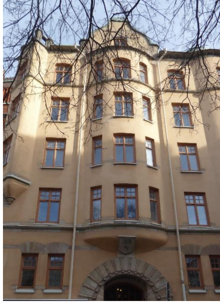
Mosebacke torg 9